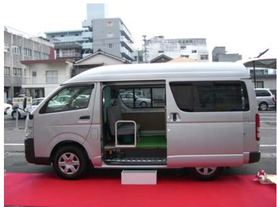
■下飯地域で導入した巡回移動連絡車の外観

(問い合わせ先) 薩摩川内市役所 市民課 住民グループ TEL 代表 0996 (23) 5111 Eメール jumin@city.satsumasendai.lg.jp