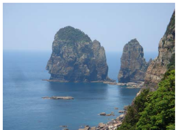
自然豊かな甑島のナポレオン岩

なお、このサービスは対象地区の高齢者を中心に大変好評であり、本市の高齢化や交通アクセス等の現状を鑑みると、今後は、本年3月から開始予定であるコンビニ交付サービスと併せて、全市域の同様の地区コミュニティセンター等にも導入できないか検討していく必要がある。