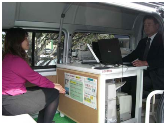
■車内では、職員が専用端末とプリンタを使って証明書を発行